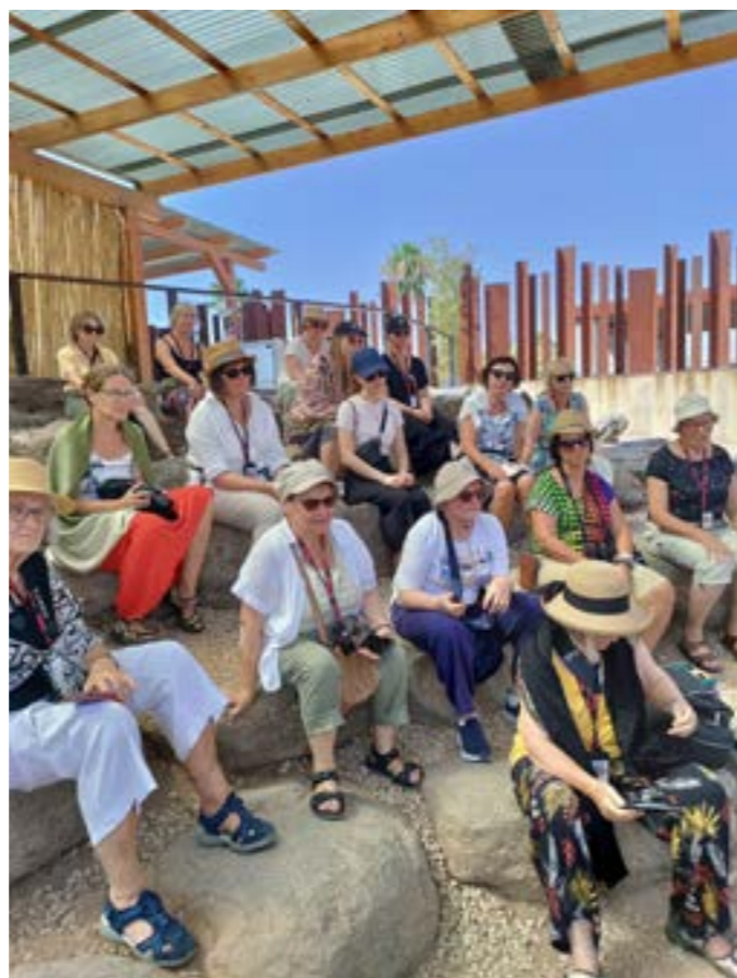
Frauengruppe beim Hören in Magdala

Danken möchten wir für die finanzielle Unterstützung der Ev.-Luth. Landeskirche Sachsens und der Ehrenamtsakademie.