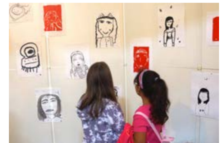
Kinder vor den Ausstellungstafeln ihrer Bilder zum Aussiedlertag in Großenhain

Natürlich gehörte zu diesem Motto auch eine Lesung. So wurden unter anderem Texte von Alita Liebrecht aus Leipzig vorgetragen. Liebrecht ist eine langjährige Unterstützerin der Aussiedlerarbeit und selbst Russlanddeutsche. Sichtbares und hörbares Merkmal dieses Projektes sind die Aussiedlerchöre, die in bunter Farbenpracht auftreten und singen.