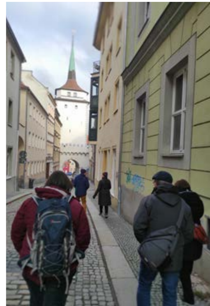
Wege durch Bautzen