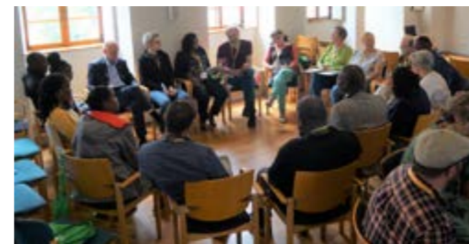
Gruppengespräche zur Bibelarbeit