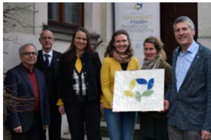
Eröffnung der Arbeitsstelle Gerechtigkeit, Frieden, Bewahrung der Schöpfung am 10. Januar 2024, in Leipzig