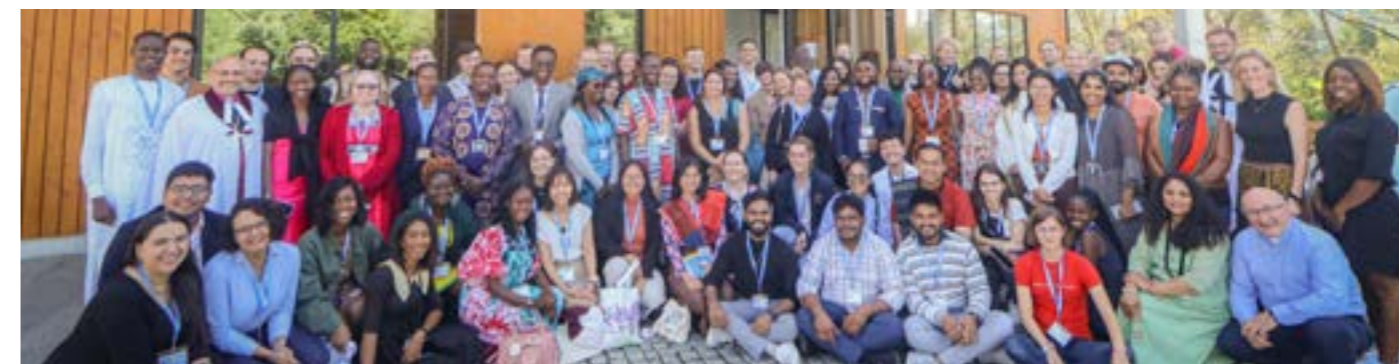
Die Teilnehmenden des LWB Youth Camps 2023

Als Pre-Event der Vollversammlung des Lutherischen Weltbundes fand vom 4.9. bis 11.9.2023 ein Jugendcamp unter dem Motto Reshape/Reform statt. In Wrocław/Breslau trafen wir 24 Teilnehmerinnen und Teilnehmer aus Afrika und Mitteleuropa erstmals aufeinander. Dort besuchten wir das „Viertel der gegenseitigen Achtung“. Das ist ein Bezirk, in dem eine Synagoge und je eine Kirche der drei Hauptkonfessionen nah beieinanderstehen und gemeinsame Wohltätigkeitsveranstaltungen organisieren. Dies basiert auf dem gegenseitigen Respekt, ungeachtet der Religion, und dem Glauben, dass jeder Mensch ein Kind Gottes ist. Unsere nächste Unterkunft befand sich in Krzyżowa/Kreisau, wo einst der Kreisauer Kreis tagte. Dort hörten wir Vorträge, beispielsweise zum Thema „Resilienz“, und arbeiteten in einem Permakulturgarten. Nicht weit von Krzyżowa entfernt befindet