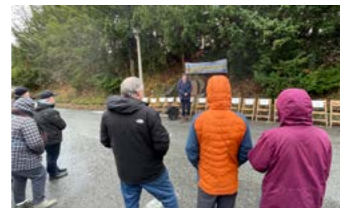
Leere Stühle am Denkmal für 1945 in Löbau erschossene Deserteure

Hintergrund ist, dass hunderttausende Menschen aus Russland, Belarus und der Ukraine seit Beginn des russischen Überfalls auf die Ukraine im Februar 2022 geflohen sind, um nicht im Krieg morden zu müssen oder getötet zu werden. Allein in Deutschland haben von Februar 2022 bis September 2023 3.500 junge Männer zwischen 18 und 45 Jahren einen Antrag auf Asyl gestellt: Nur 400 der Anträge wurden zugelassen und bearbeitet – nur 90 davon wurden positiv entschieden. Vielen jungen Russen droht die Abschiebung. Auch junge Ukrainer im „wehrfähigen Alter“, die nach Deutschland geflohen sind, haben hierzulande nur bis März 2025 Schutz. Das Netzwerk der Friedensbeauftragten, die Evangelische