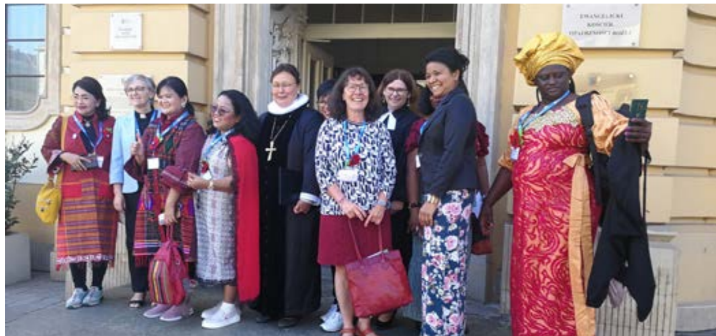
Teilnehmende der Frauenvorversammlung in Wrocław/Breslau

Projektkoordinatorin des Frauennetzwerkes des LWB für Zentral- und Westeuropa Gleichstellungsbeauftragte der EVLKS