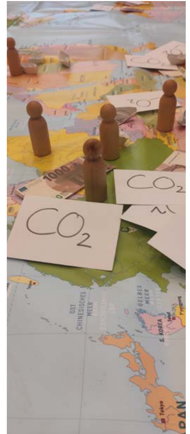
Workshop „Konfi und die Eine Welt“ beim Ökumenischen Thementag in Bautzen

Beauftragte für Kirchlichen Entwicklungsdienst