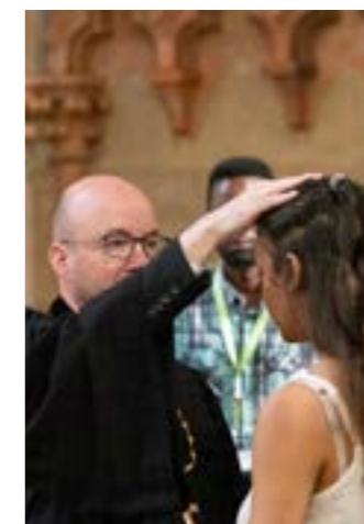
Segnung der Outgoing-Freiwilligen des LMW Predigt von Bischof Dr. Christian Samraj (Indien) im Festgottesdienst durch Landesbischof Bilz Festgottesdienst

Möglichkeiten der Begegnung boten sich auch am folgenden Tag auf dem Empfang der Kirchenleitung in Dresden. Eine Fahrt nach Wittenberg rundete das dicht gefüllte Tagungsprogramm ab.