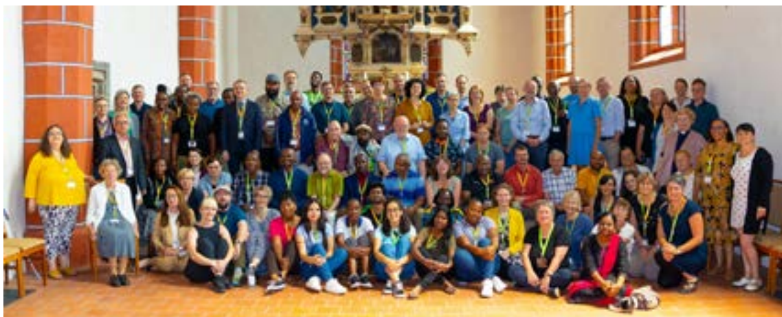
Die Teilnehmenden der 2. Internationalen Partnerschaftstagung 2023 in der St. Afra Kirche in Meißen