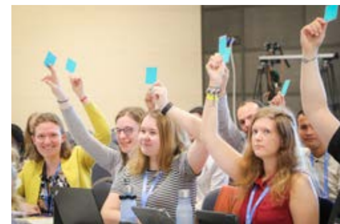
Jugend-Vorversammlung des Lutherischen Weltbundes

Neben dem thematischen Arbeiten standen das gemeinsame Feiern sowie Andachten und Gottesdienste im Fokus, sodass neben der Freude über das Zusammensein auch Leid und