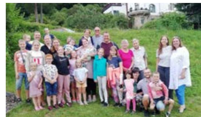
Familienurlaub in Rathen

Ein besonderer Höhepunkt im Jahr 2023 war der Besuch der Partnerkirchen der Solidarkasse in Rumänien. Insgesamt ist die Solidarkasse dort mit vier Kirchen in Verbindung – zwei lutherischen Kirchen, eine deutsch-, eine ungarischsprachig, und zwei reformierten Kirchen, beide ungarischsprachig. In drei dieser vier Kirchen erfolgte 2023 ein Wechsel der Personen, die Ansprechpartner für uns sind. Es war ein großer Vorteil, dass unsere Reise genau in dieser Situation stattfinden konnte. Die einzelnen Verantwortlichen, mit denen wir sonst nur per E-Mail oder Telefon kommunizieren, nun persönlich zu kennen,