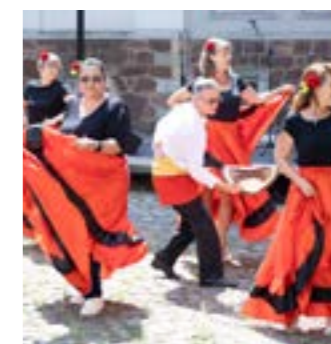
Teilnehmende aus Kolumbien und ihre Gäste aus Tansania vor dem Baum ihrer lutherischen deutschen Partner präsentieren einen Tanz Kirche im Luthergarten Wittenberg (Foto: EVLKS) beim Begegnungsfest (Foto: EVLKS)

Für Gäste und Gastgeber war die Tagung ein eindrückliches Erlebnis. Das weltweite Netzwerk unserer Partnerschaften wurde sichtbar, neue Verbindungen wurden geknüpft. Es wurde dazu ermutigt, weitere Engagierte zu gewinnen und auch zu einem Generationswechsel in der Partnerschaftsarbeit beizutragen. So war es besonders schön, dass junge