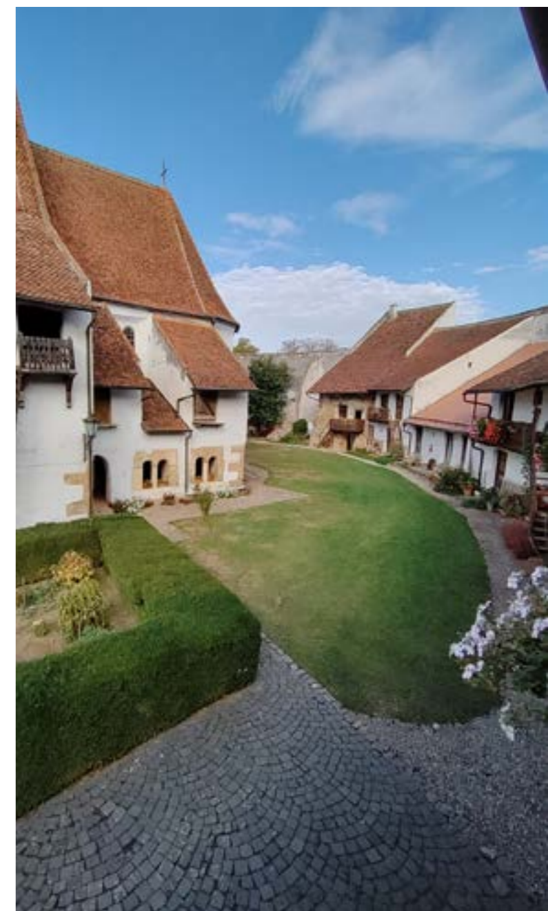
Kirchenburg Honigberg