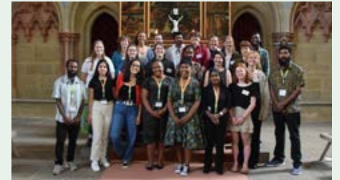
Freiwillige des Leipziger Missionswerks beim Festgottesdienst in Meißen am 18. Juni 2023