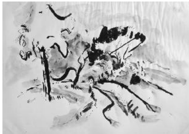
Paar im Garten, 1973, Pinsel / Feder, Tusche laviert