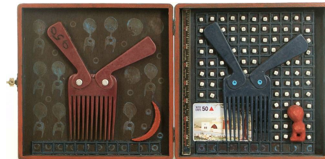
Jizchak und Jischmael Objekt: Zigarrenkiste, verschiedene Materialien, 2007

Und – gibt es den "Anderen" nicht auch in uns selbst?