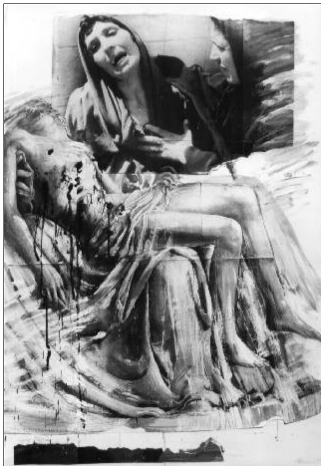
Immerwährende Passion. Weltpressefoto 1998 in Kombination mit einer Pietà von Michelangelo. Collage, Mischtechnik. 1999