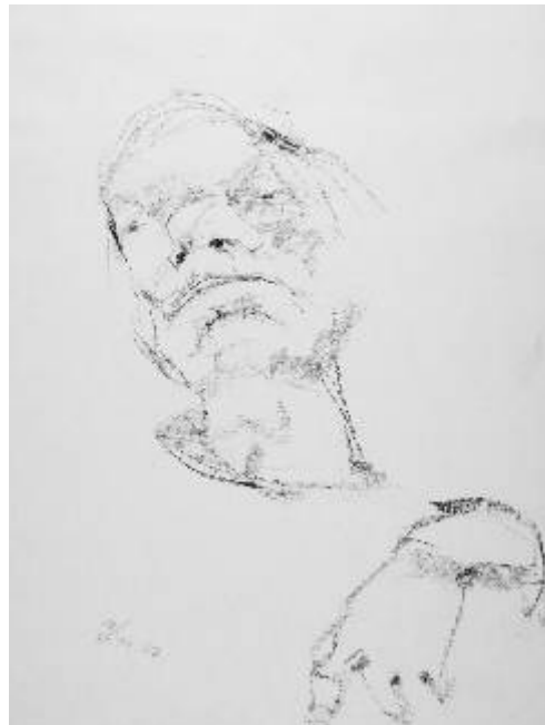
Manfred schwerkrank, 2007, Kohle auf Papier