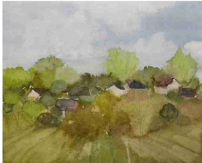
Landschaft, Aquarell, 2007